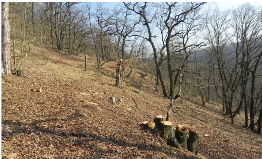
Hardecká stráň po proředění porostu. Předpokládaná periodičita zásahů 5 až 7 let.

Nezasvěcený pozorovatel může získat absurdní pocit, že na Šumavě je pranýřován každý, kdo skácí strom, naopak v Podyjí je za stejného vyslance pekla považován ten, který strom neskácí. Přitom Podyjí je dynamickou laboratoří, kde se možnost sladění zdánlivě protichůdných požadavků ochrany přírody intenzivně hledá a nachází. Mimochodem Správa NP Podyjí byla v první skupině organizací, které získaly