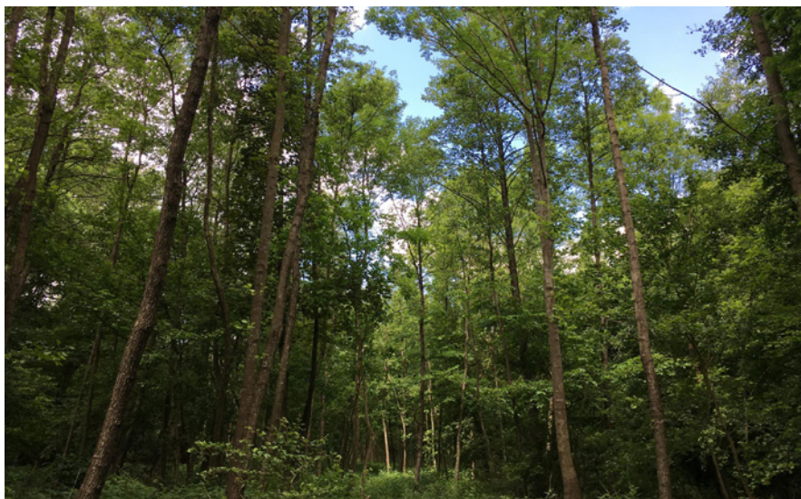
Maďarská lokalita hnědáka a ty nejmenší jasan, které tam samičky mají k dispozici ke kladení snůšek (kolem 13 m). Snůšky jsou s největší pravděpodobností kladeny i na mnohem vzrostlejší jasan. Motýli se tedy také vyskytují v korunách stromů. Mária út, Bük, květen 2017.

Veskrze akademická diskuze o monitoringu hnědáka se dá shrnout následovně: je hezké mít doma Mercedes, ale k bohatému rodinnému životu úplně stačí i Škodovka.