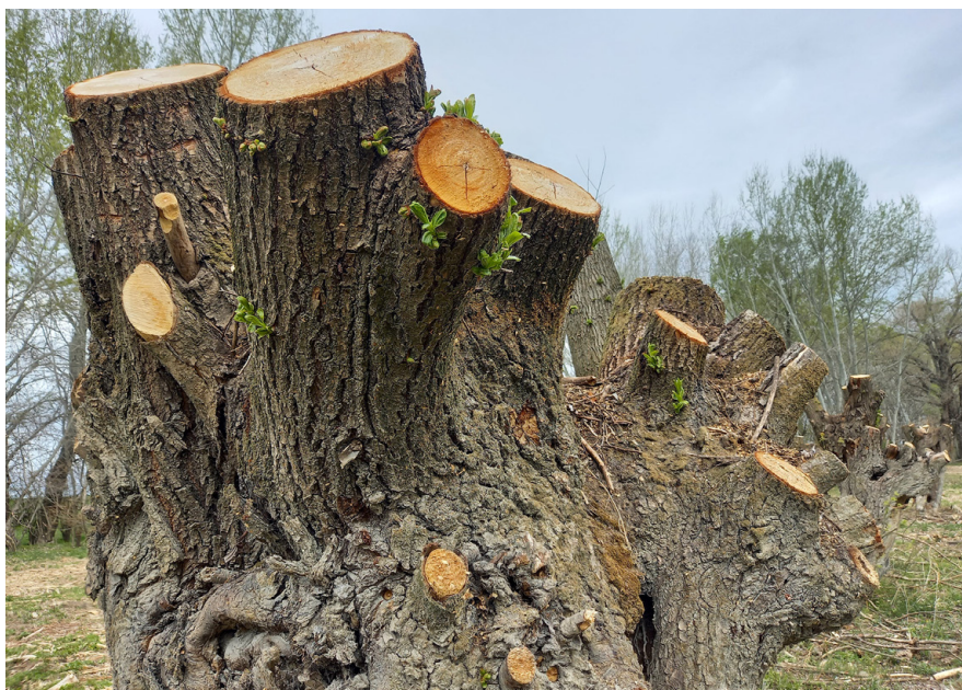
Z návratu tradičného orezávaniu hlavových vrúb sa teší veľké množstvo druhov húb, lariev, chrobákov, motýľov i mravcov. Okrem nich dutiny využívajú netopiere a kuny ako svoje úkryty a hniezdia v nich aj vtáci, napríklad červienky, kačice a kedysi a aj divé husi.

Áno, BROZ vlastní už nemalé množstvo pozemkov v chránených územiach. To sa už na Slovensku stalo terčom kritiky rôznych dezolátov na sociálnych sieťach. Hor-