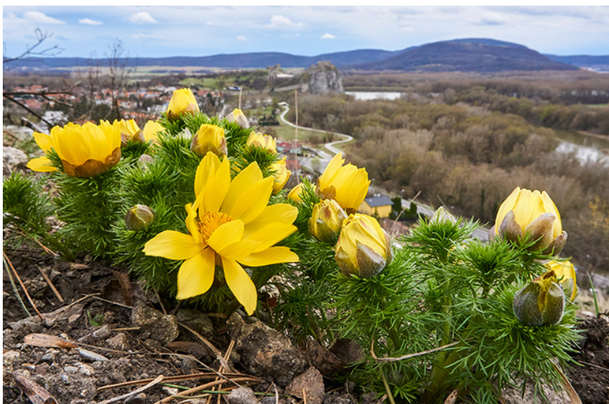
Manažment územia Devinskej Kobyly podporuje zachovávať a obnovovať vzácné špecifické lesostepné biotopy.