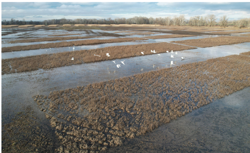
Mokrade patria medzi druhovo najbohatšie ekosystémy na Zemi.

Naším cieľom je neustále zlepšovať praktické ochranné opatrenia na lokalitách, starať sa o naše územia s citom a postupne rozširovať územia, ktoré sú pod našou ochranou a natrvalo ich venovať prírode.