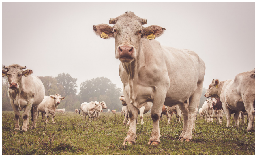
Pastva na lokalitách a Veľkom Léli sa postarala o malebný trávnatý ráz krajiny so vzácnou faunou a flórou.

Tam kde je to možné, poskytujeme naše lúky a pasienky do obhospodarovania miestnym farmárom a gazdom, s určením presných požiadaviek, limitov a cieľov starostlivosti. Žiaľ nie všade sa už dnes nachádzajú ľudia, ktorí chcú, vedia a sú