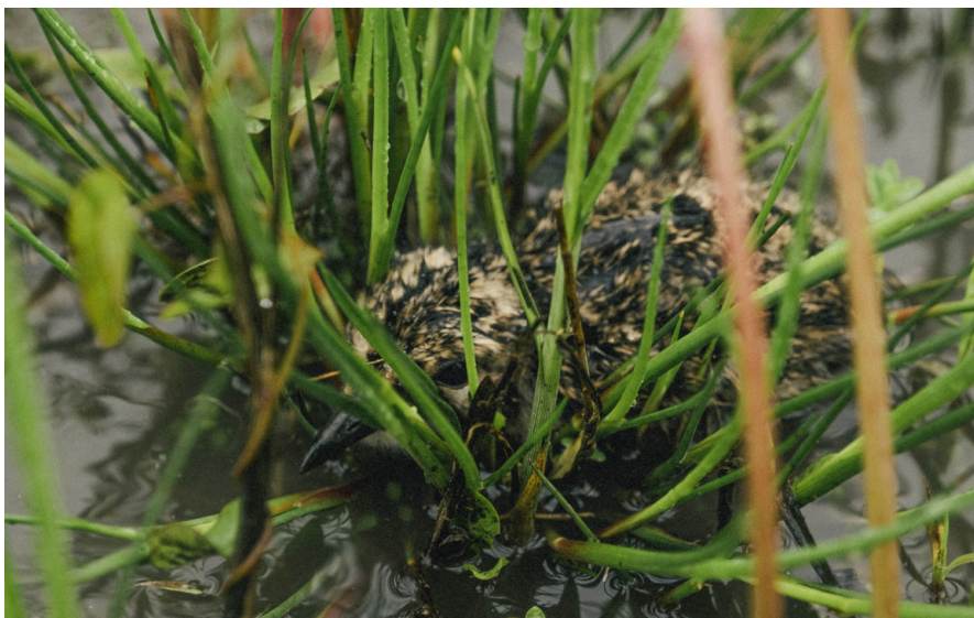
Mláďa vzácného cíbika chochlatého ( Vanellus vanellus ) v mokradi Čiližskej Radvani.

Je to zamokrené územie, ktoré sa nachádza uprostred poľnohospodárskych polí a ktoré bolo pôvodne súčasťou rozľahlých Čiližských močiarov. Veľká časť z Čiližských močiarov sa dostala do siete Natura 2000 a momentálne je to ÚEV Čiližské močiare. Týchto 42 hektárov sa však chybnou do Na-