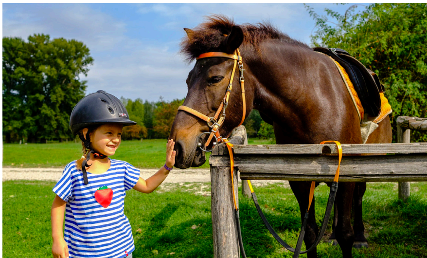
V prostredí dunajskej prírody na Velkolélskom ostrove každoročne organizujeme letné jazdecké tábory.

Pre návštevníkov ostrova sú k dispozícii turistické mapy s tromi rôznymi trasami ale aj sprevádzané exkurzie, ktoré máme vo