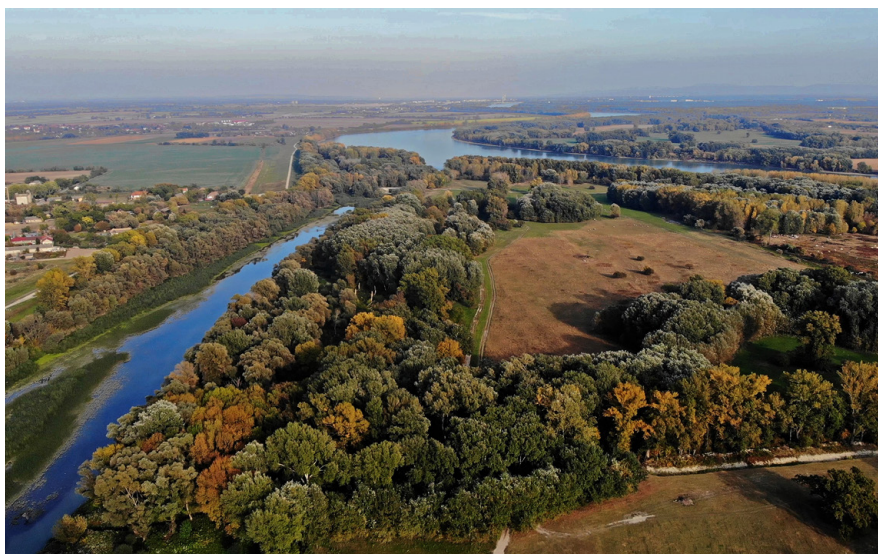
Velkolélsky ostrov je dobre známy na oboch stranách Dunaja ako jeden z posledných veľkých dunajských ostrovov.

ochotní robiť takúto prácu a viesť takýto životný štýl. Ale čím ďalej od Bratislavy sa nachádzame, tým jednoduchšie je takýchto partnerov nájsť.