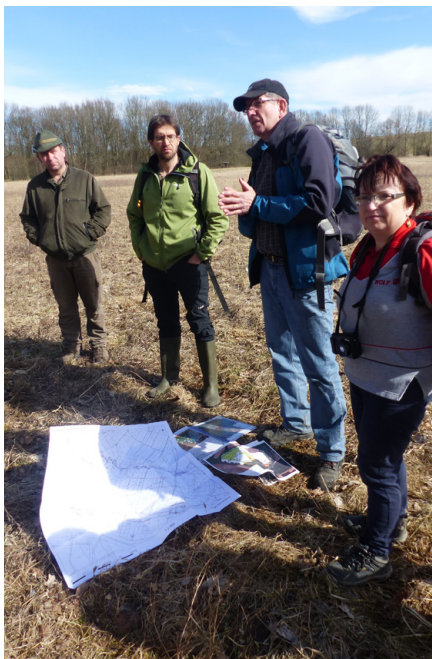
Velkojarměřský pozemkový spolek - z jednání s krajským úřadem a dalšími partnery v přírodní rezervaci Zbytka.

Jak napsáno výše, lokality k výkupu navrhnou většinou pozemkové spolky. Někdy jde