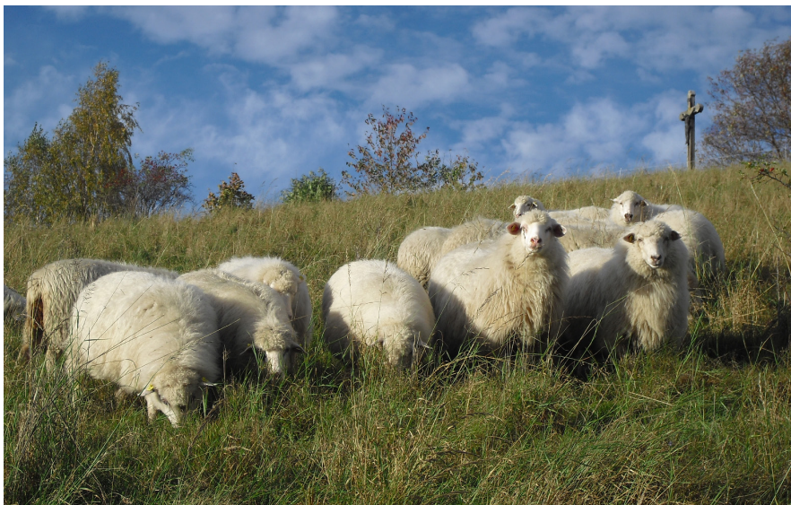
S údržbou mnohých lokalit pomáhají i ovce - Místo pro přírodu Velká Homolka v péči pozemkového spolku Šumava.

ných pozemků je Český svaz ochránců přírody, místní pozemkové spolky je přebírají do své péče.