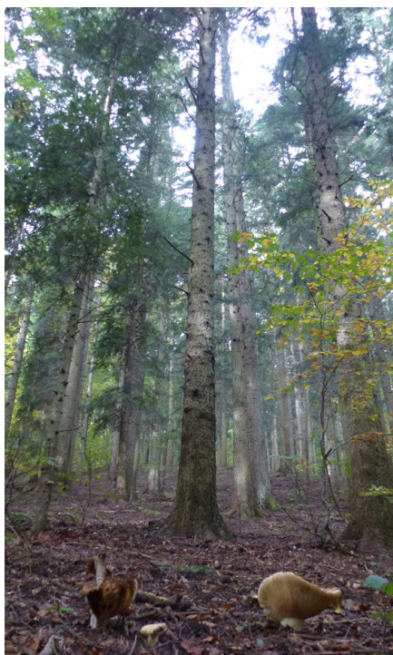
Asi nejznámějším Místem pro přírodu je bělokarpatská Ščúrica - několik hektraů starého jedlobukového porostu, který měl být vykácen.

jako specifické právnické osoby (obdobně, jako jsou např. nadace) a na existenci této osoby by po vzoru Velké Británie vázala nezczitelnost nemovitostí, případně i určité daňové výhody. K tomu nikdy nedošlo, a v komunitě dodnes nepanuje shoda, zda to je dobře nebo špatně. Každopádně, hnutí pozemkových spolků se v následujících letech dostalo výhradně do režie neziskového sektoru.