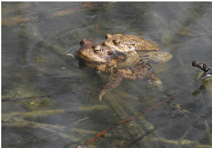
První lokalitou vykoupenou v rámci Místa pro přírodu bylo jezírko TRIangl - kousek divočiny přímo v hlavním městě (páření ropuch).

V počátcích hnutí se uvažovalo s výrazně silnější rolí státu. Existovaly úvahy, že by pozemkové spolky byly zákonem ustaveny