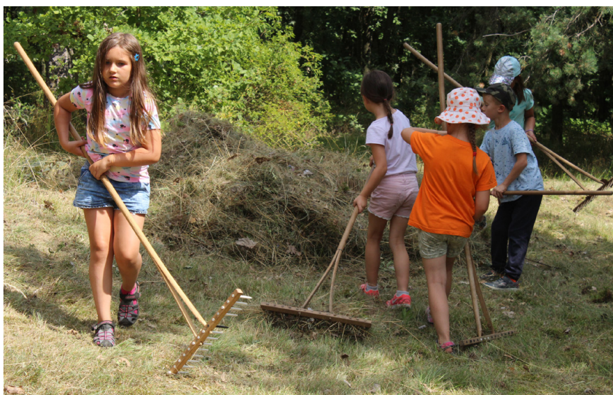
Tzv. Den na louce - akce pro veřejnost pozemkového spolku Prostějovsko.

Charakter akreditovaných pozemkových spolků je velmi rozdílný. Jsou mezi nimi organizace čistě dobrovolnické i organizace více či méně profesionalizované, organizace spíše „rodinného“ typu i organizace se stovkami členů a příznivců (nejčastěji jde o organizace s 10-15 členy), spolky pečující o jedinou lokalitu (takových je 12) i spolky mající v péči stovky hektarů (k největším patří Velkojaroměřský pozemkový spolek / ČSOP Jaro Jaroměř, Pozemkový spolek Čertoryje / ČSOP Bílé Karpaty, Pozemkový spolek pro přírodu a památky Podblanicka / ČSOP Vlašim a Sagittaria). Akreditované pozemkové spolky v současné době pečují o téměř 4000 ha přírodních významných ploch. Nejčastějším právním vztahem k nim jsou užívací smlouvy (výpůjčka, pacht, nájem). Ve vlastnictví mají