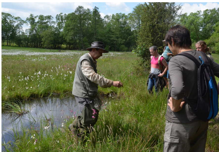
Důležitou součástí činnosti pozemkových spolků je i představovat svojí práci, její smysl a výsledky veřejnosti - exkurze na lokaitě Na Pramenech.