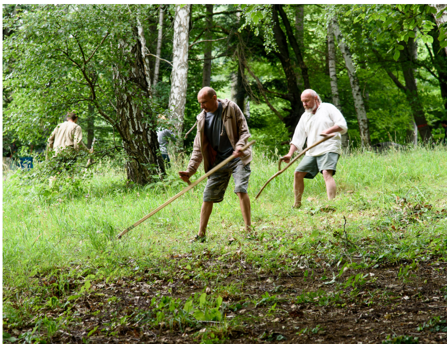
Na Kosence - ale i v mnoha dalších pozemkových spolcích - se louky dosud kosí ručně.

Veřejná sbírka Místo pro přírodu byla vyhlášena v roce 2003 jako vůbec první sbírka u nás, jejímž cílem jsou výkupy pozemků ve prospěch přírody. Vykupují se buď pozemky přírodně hodnotné z důvodu jejich ochrany, nebo pozemky vhodné k vytváření nových (respektive obnovených) přírodních stanovišť. Vlastníkem vykoupe-