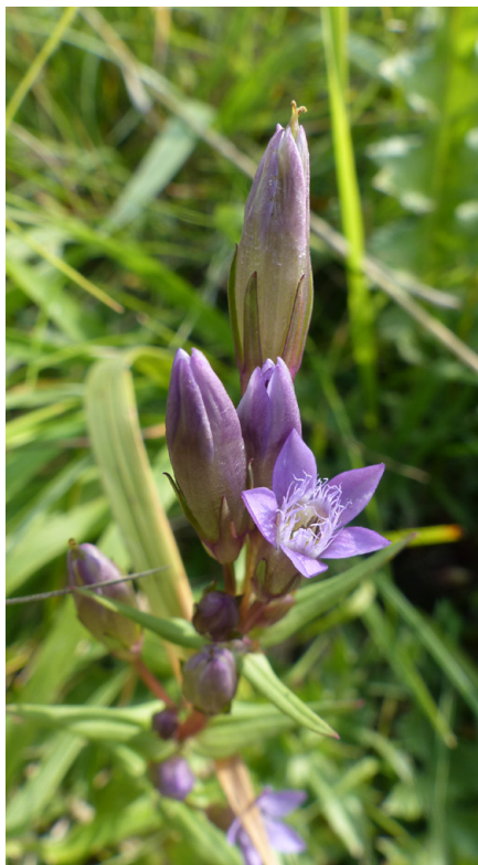
Mezi Místy pro přírodu jsou již dvě lokality kriticky ohroženého hořečku nahořklého.

zájem o tyto lokality nepolevil ani po vyhlášení zákonné ochrany.