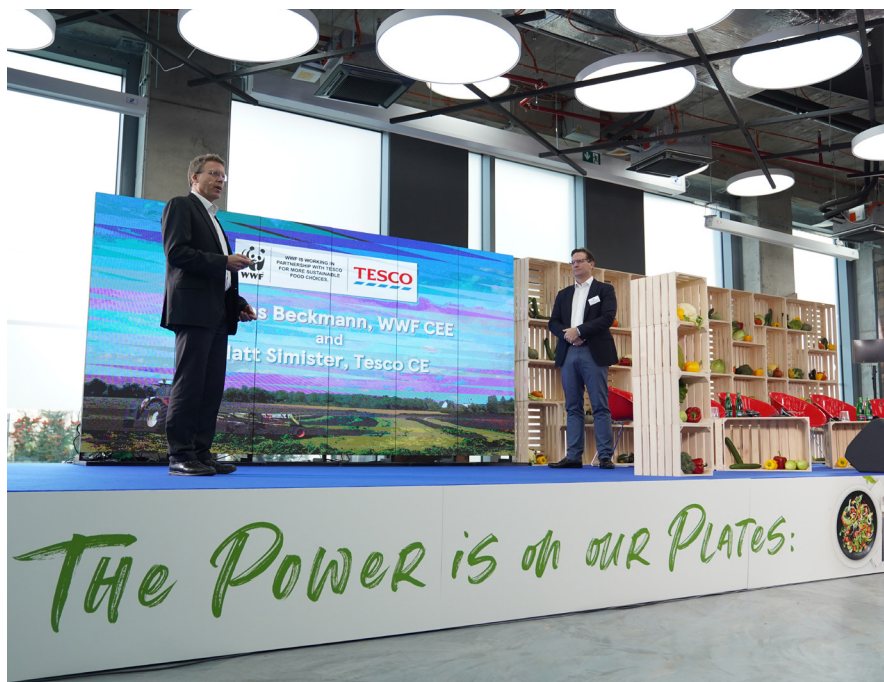
Se společností Tesco jsme spolupracovali na snížení dopadu průměrného nákupního koše s potravinami ve střední Evropě na životní prostředí a klima.

a Ukrajinu). Pobočka WWF Česko by u nás měla vzniknout na podzim letošního roku. WWF se v Česku zatím zaměřuje, kromě podpory konkrétních ochranných aktivit a advokační práce zejména ve vztahu k obnově přírody, na oblast udržitelných potravinových systémů a zlepšování stavu zemědělské krajiny (viz wwf.cz.org ). Vyдали jsme například Příručku péče o půdu, průvodce nejen pro zemědělce (2024),