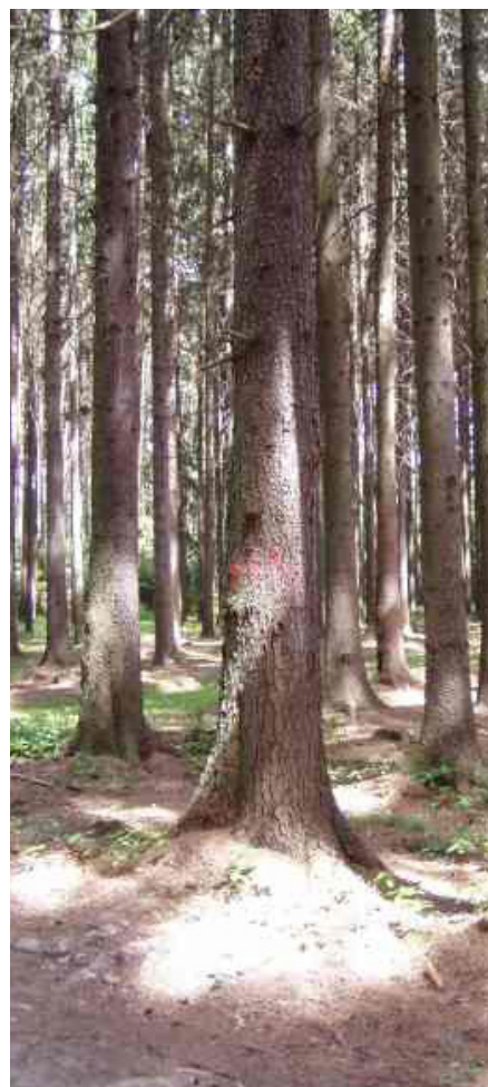
Běžný výchozí stav porostů před jejich adaptací.

Toto Opatření se soustřeďuje primárně na podporu biodiverzity. Z pohledu ochrany přírody se týká převážně