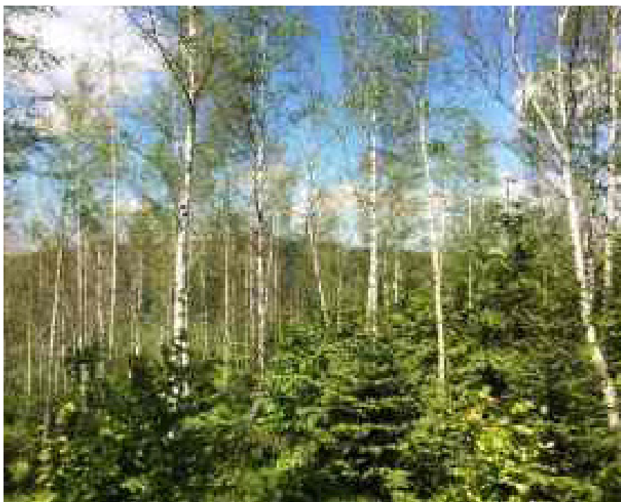
Práci s porostem pionýrských dřevin lze založit a pěstovat produkční, ale po všech stránkách pestřejší les. Pokud jej někdo v následujících desetiletích zase nezjednoduší. Autor neznámý

Povinnost výsadeb melioračních a zpevňujících dřevin (MZD) je dána zákonem od r. 1996. Zejména v souvislosti s kůrovcovou kalamitou začalo docházet ke zvyšování limitu MZD diferencovaně podle stanovišť podzákonými předpisy (zejména viz vyhláška č. 298/2018 Sb.), kde byl zejména v nižších a středních polohách zvýšen podíl MZD na 40-50 %. To koresponduje s doporučeními k budoucí dřevinné skladbě (smrk 37 %, borovice 17 %, ostatní jehličnany 11 %, dub 9 %, buk 18 %, ostatní listnáče 9 %). Vyhláška č. 298/2018 Sb. a vyhláška č. 456/2021 Sb. dále zásadně přispěly k většímu využití přirozené obnovy včetně celé škály přípravných dřevin. Problémem do budoucna ale není ani tak nedostatečný podíl MZD na obnově umělé, jako spíše limitace přirozené obnovy MZD