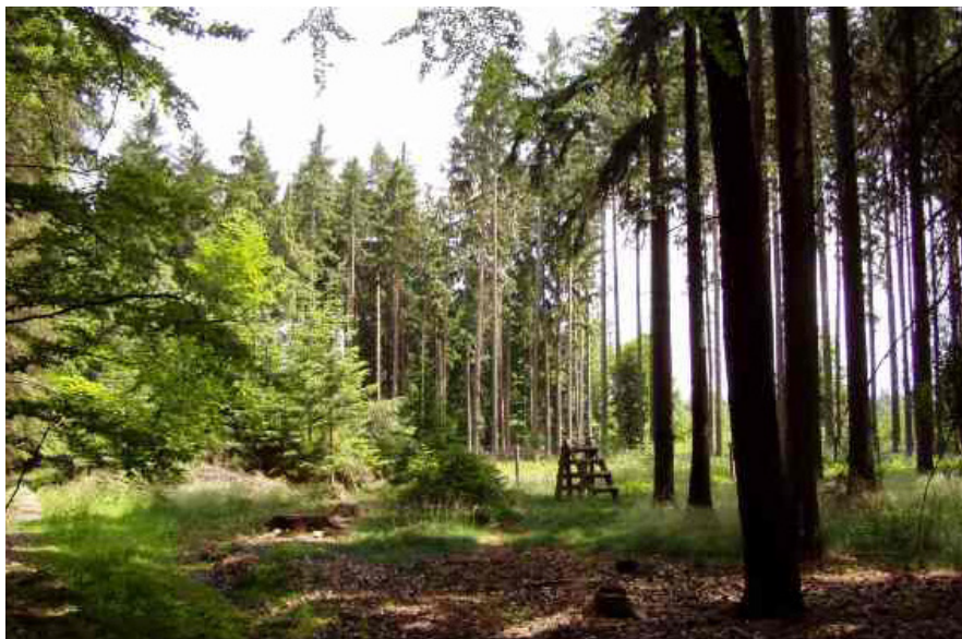
Skočit z lesa věkových tříd rovnou do lesa výběrného nejde. Lepšímu stavu a odolnosti můžeme jít jenom trochu naproti vnesením listnáčů a jedle a podporou přirozené obnovy opatrnou regulací horní stromové vrstvy.

Jednání skupiny se konala převážně distančně (on-line, s výjimkou jednoho celodenního osobního jednání) každých 14 dní