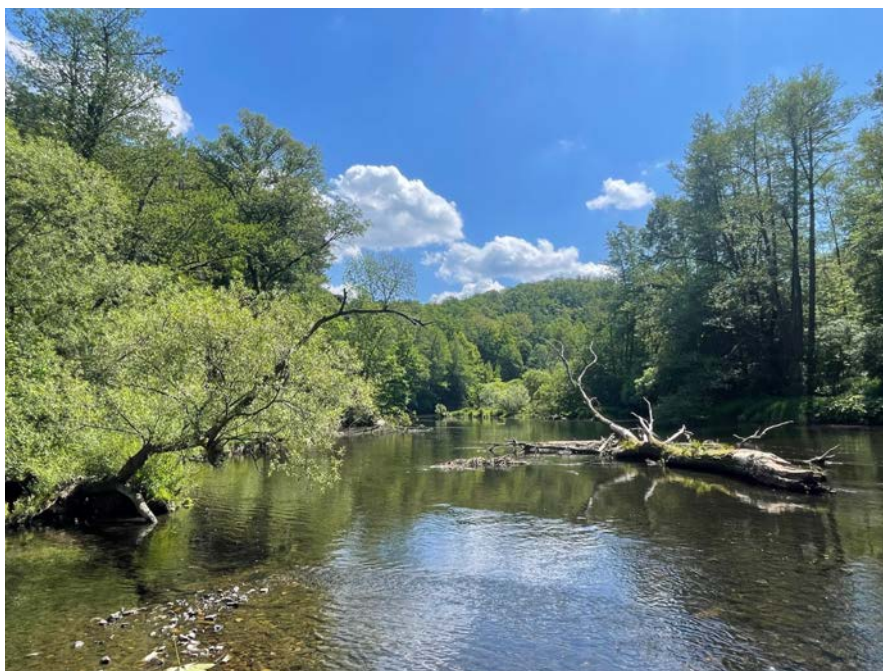
V národním parku může v řece zůstat mrtvé dřevo...

odolné vůči klimatickým extrémům a obhospodařované s respektem k přirozeným procesům. Nepasečné hospodaření a přirozená obnova mohou být cestou, jak udržet lesy zdravé a produktivní. Přirozená pestrost činí lesy odolnějšími.