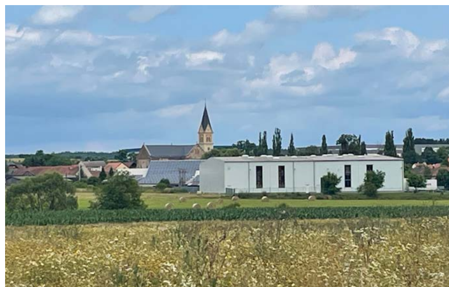
Nekoncepční plánování se projevuje neharmonickými obrazy.

nefunguje, nás nedokáže ochránit před klimatickými výkyvy, zajistit dostatek vody,