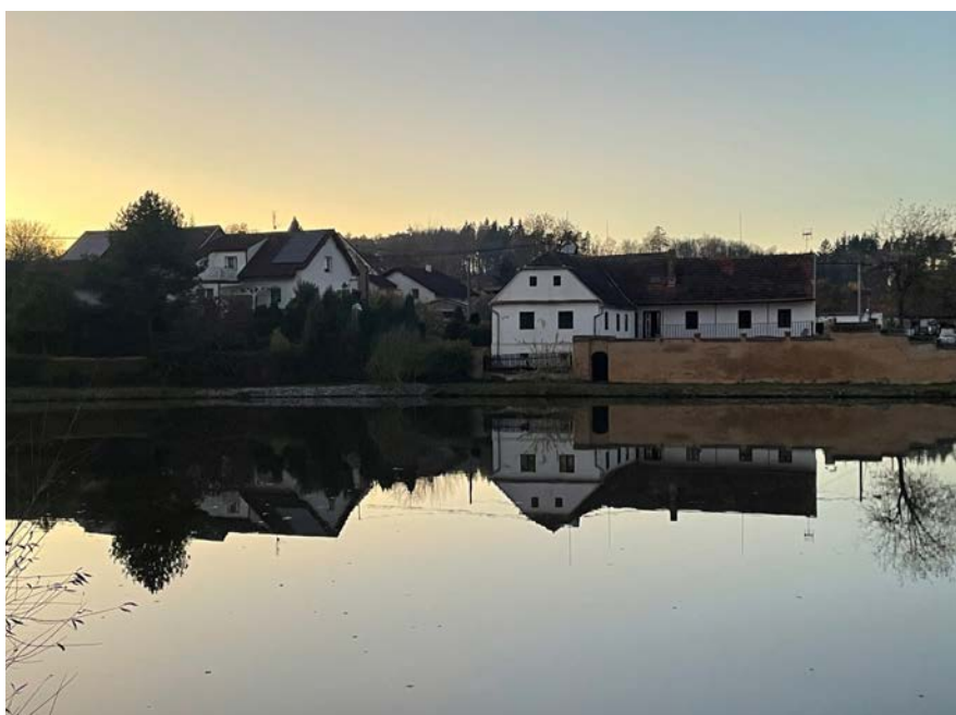
Otisk činnosti předků se zrcadlí v současné krajině.

Základní kvalitou je tedy život, dobrý život, zahrnující zdraví a odolnost. Je dobré si uvědomit, nakolik se pohybujeme v perspektivě lidské nebo přírodní a jak úzce