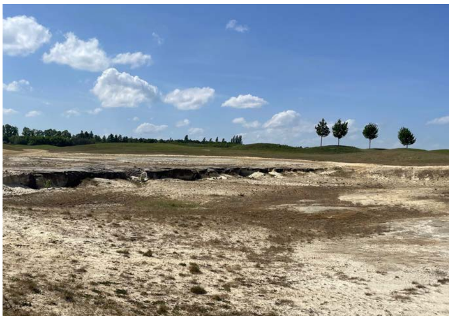
.. ale i písník na golfovém hřišti poskytuje místo biodiverzitě.

Do podoby krajiny se promítají přání a potřeby lidí. Klíčem k souladu je synergie mezi územním a krajinným plánováním, která umožňuje zahrnout místní komunitu do rozhodování. Péče o krajinu tak není jen abstraktní strategií, ale sdíleným úsilím, ve kterém se lidé cítí být zapojeni a motivováni přispět. Krajina, o kterou společně pečujeme, se nám vrací v podobě bezpečí, stability a krásy. Je to prostor, kde se spojují příroda, kultura a odpovědnost – nejen naše, ale i těch, kteří přijdou po nás.