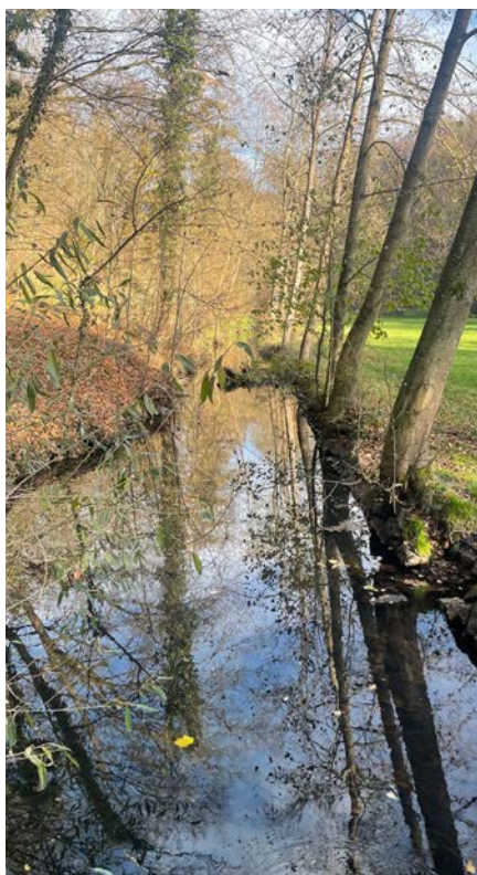
Obnova říční krajiny je základem pro život...

jsou obě propojené. Snaha o zlepšování stavu krajiny by neměla být vnímána jako gesto od lidí „pro přírodu“. Jde o hlubší pochopení, že kvalita života lidí na Zemi je neoddělitelně spjata s kvalitou přírodního prostředí. Příroda nás živí, chrání a umožňuje nám existovat. Pokud ji přivádíme do stavu, kdy není schopná tyto funkce plnit, největší oběti neseme my sami.