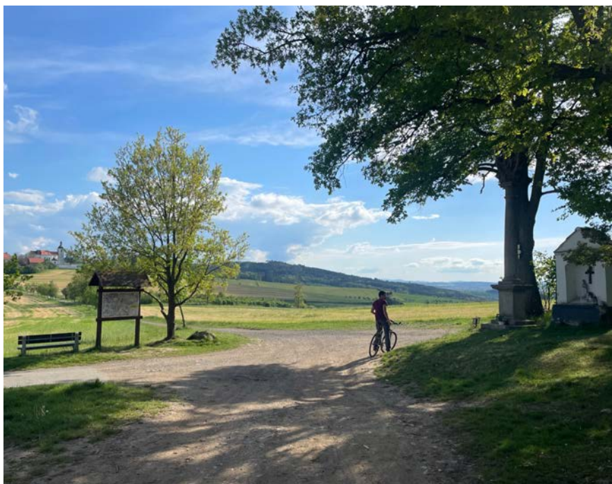
Na rozcestí mezi zemědělstvím, lesem, kulturní krajinou a biodiverzitou - kam půjdeme?

potravy ani prostor pro kvalitní život. Bez řešení těchto kritických problémů ohrožujeme nejen přírodní prostředí, ale i základní podmínky pro další generace.