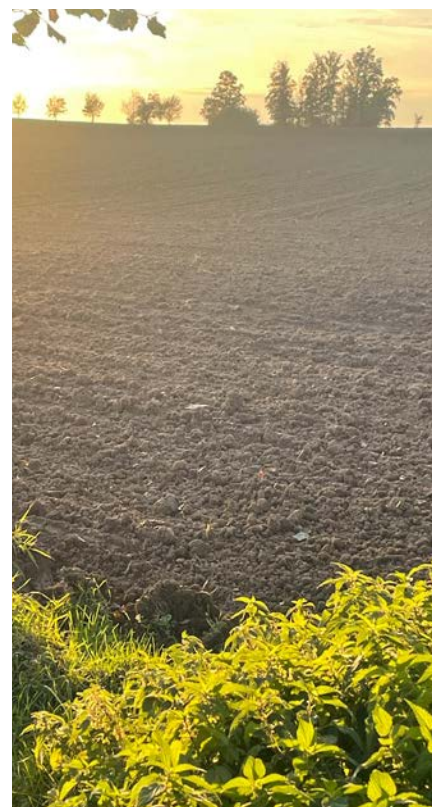
... naopak intenzivní zemědělství svědčí jen úzkému okruhu rostlin - jako kopřiva, která má ráda nadbytek živin.

Lesy ale nejsou jen zásobárnou dřeva, jsou místem odpočinku, domovem rozmanitého života. Budoucnost patří lesům, které jsou druhově, věkově a prostorově pestré,