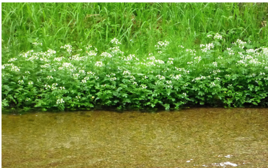
Průhlednost až na hrubozrné písčité dno a na břehu řeřišnice hořká, zdroj kvalitní potravy, to je pohled na přirozený habitat v lokalitě Malše.

Poslední lokality perlorodky jsou součástí některého ze zvláště chráněných území, jako je Národní park a chráněná krajinná oblast Šumava, národní přírodní památky Blanice, Prameniště Blanice, Lužní potok a Jankovský potok nebo dalších kategorií např. přírodní památka Horní Malše, přírodní rezervace Bystřina a Miletínky (a několik let připravované Národní přírodní památky Zlatý potok). Zvláště chráněná území mají svoje ochranné podmínky definované zákonem, de facto se jedná o omezení formou zákazů daných pro každou kategorii. Specifika jednotlivých území se upravují vyhlášovacím předpisy a ochrana může cílit jak na ekosystémy, tak na druhy.