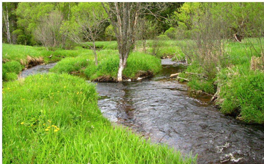
Přirozený úsek koryta toku i říční nivy Blanice, domova největší naší populace perlorodky říční.

V rámci tohoto projektu chceme informovat veřejnost, a to především obyvatele nejvýznamnějších povodí s výskytem perlorodky (Malše, Blanice) o její biologii a o záchranném programu perlorodky říční v České republice. Dále zmapovat potřeby stakeholderů, ustanovit systém garantů těchto lokalit a digitálně zpracovat data, která byla v rámci výzkumu perlorodky a záchranného programu získána v uplynulých třiceti letech. Nositelem projektu je AOPK ČR a partnerem,