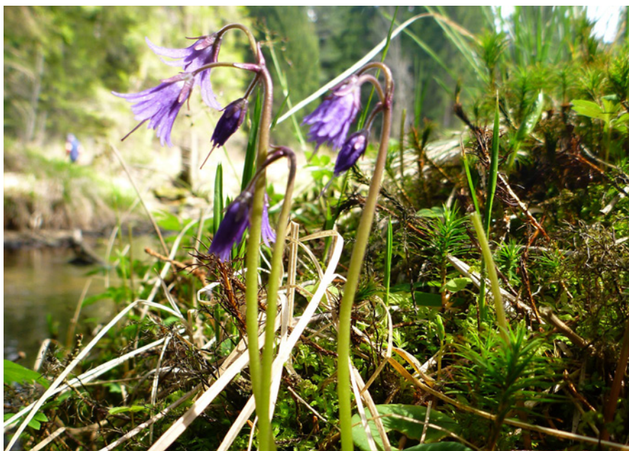
Oligotrofní podmínky na břehu Malše vyhovují i dřipatce horské.

horní části potoků a řek pramenících na geologickém podloží s nízkým obsahem vápníku.